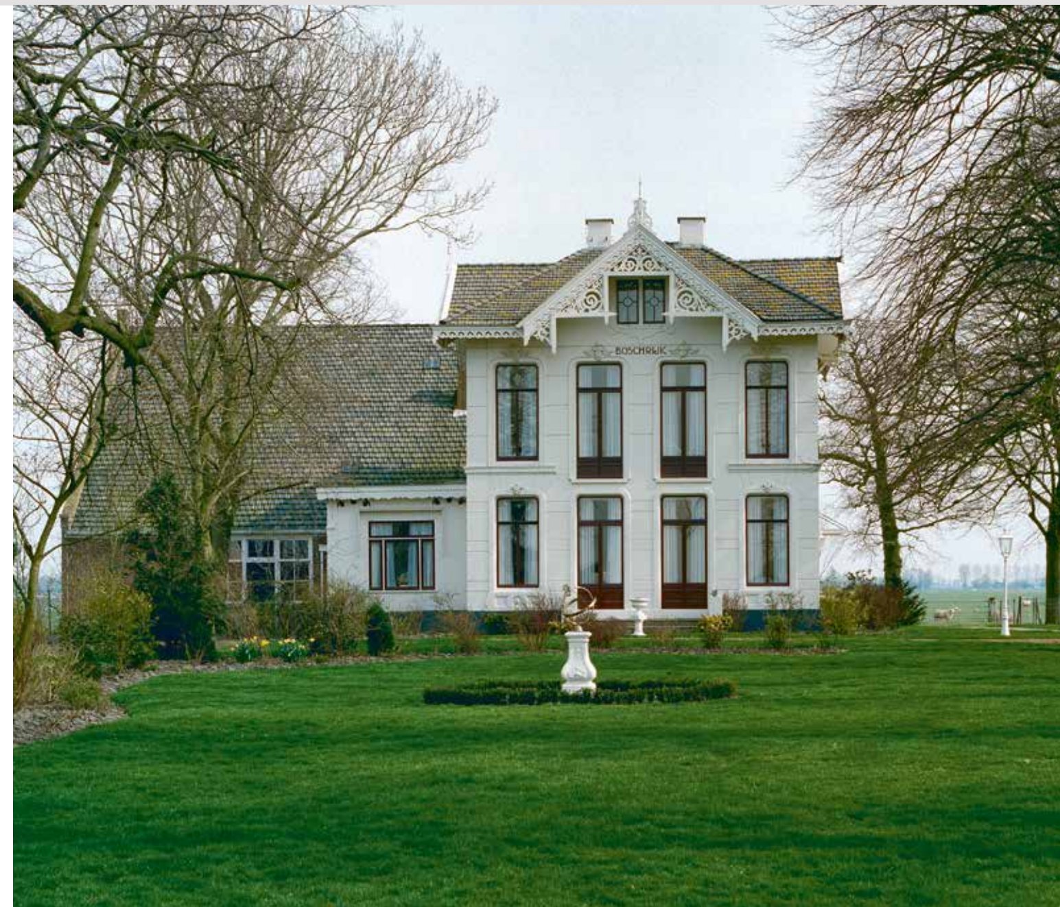
1850 Boschrijk 1998

Droogmakerij De Beemster is in de 17de eeuw tot stand gekomen. De grote droogmakerij van het binnenmeer werd gefinancierd door rijke stedelingen, bijvoorbeeld uit Amsterdam of Alkmaar. Zij deden dat als belegging van hun kapitaal, vanuit de wil om de strijd tegen het water te winnen en uit behoefte aan landbouwgrond. Hiervoor verrees direct na het verkavelen van de vruchtbare kleigronden een reeks grote pachtboerderijen. Hoewel de Noord-Hollandse stolp nog maar kort tevoren ontstaan moet zijn, bleek hier hoe het type al tot volle wasdom was gekomen. De stolpen hebben een sterke verwijzing